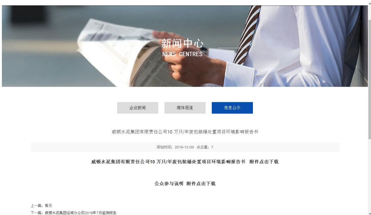
图 6-1 网络公开

本次公开采用网络公开方式,采用威顿水泥集团有限责任公司官网为网络载体,符合《环境影响评价公众参与办法》要求。公开时间为 2019 年 8 月 21 日,网址为(www.sxwdgs.com),网络公开截图见图 6-1。