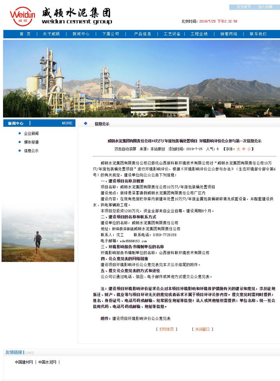
图 2-1 首次网络公示

建设单位于2019年7月25日在威顿水泥集团有限责任公司官网通知公告栏中进行了本项目首次公示，网络公示截图见图2-1。本次公示载体为建设单位威顿水泥集团有限责任公司官网，属于网络平台，符合《环境影响评价公众参与办法》要求。