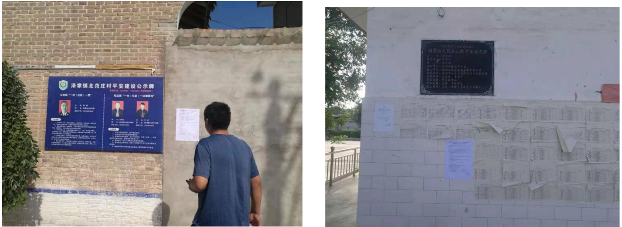
图 3-3 张贴公示