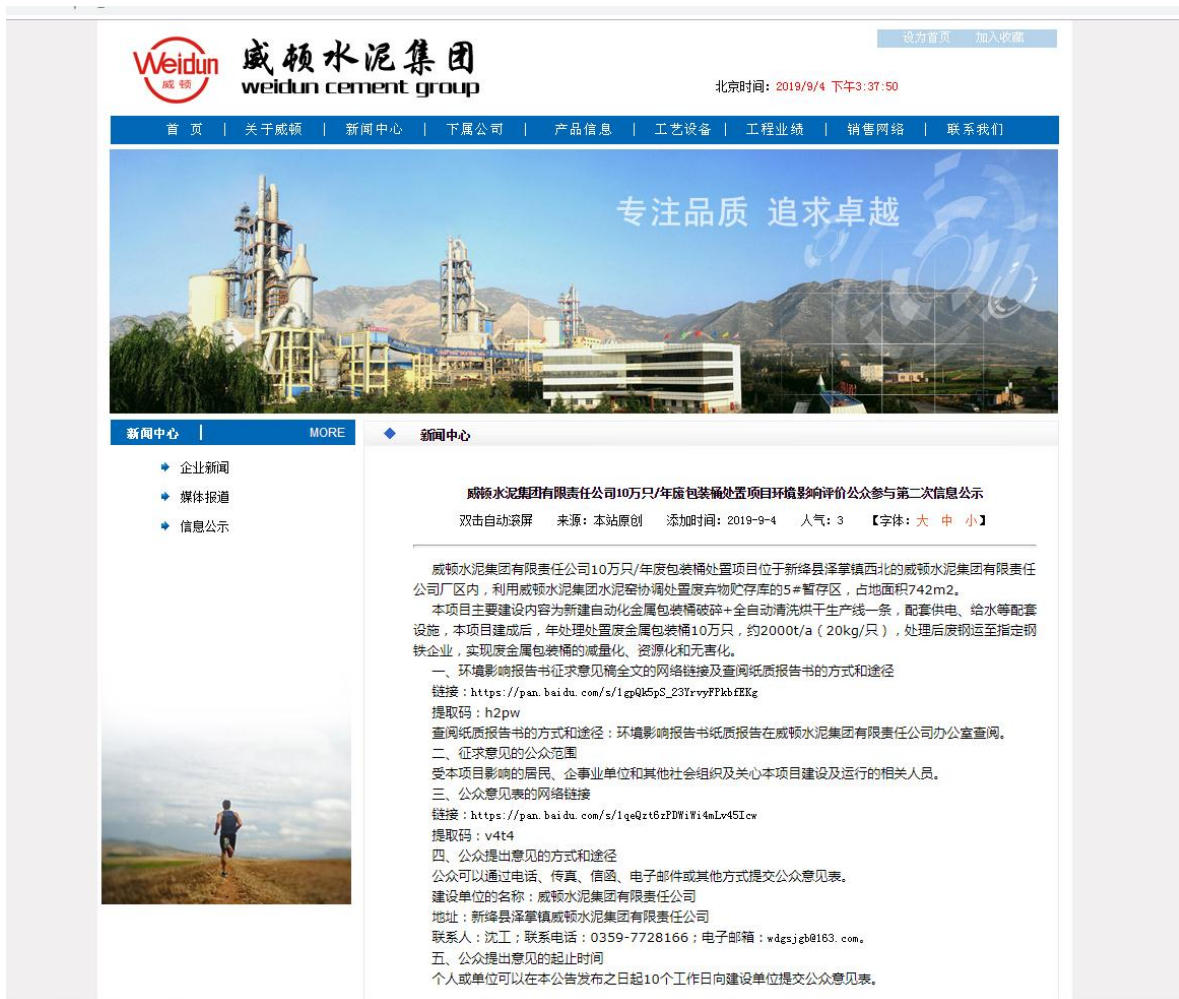
图 3-1 征求意见稿网络公示

建设单位于 2019 年 9 月 4 日在威顿水泥集团有限责任公司官网通知公告栏中进行了二次公示，网络公示截图见图 3-1。本次网络公示载体威顿水泥集团有限责任公司官网为网络平台，符合《环境影响评价公众参与办法》要求。